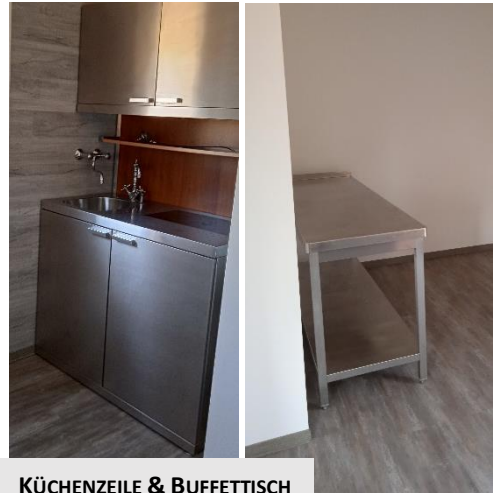
KÜCHENZEILE & BUFFETTISCH

Bisher war das Rote Haus auch vermietbar für private Anlässe. Ab 2022 erfolgt die Vermietung nur noch für Tagungen, Workshops und Schulungen.