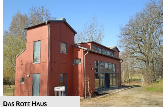
DAS ROTE HAUS