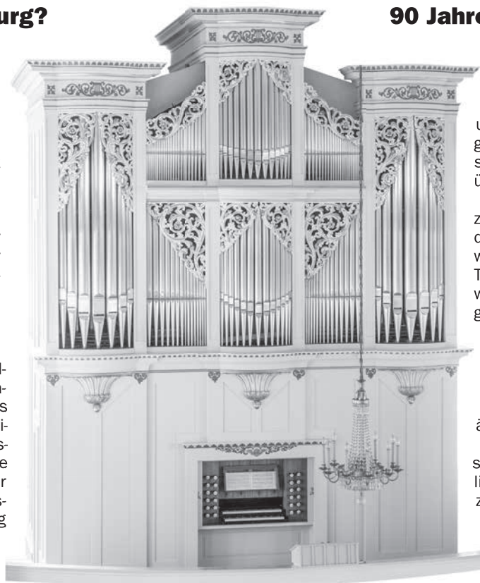
Göthel-Organ in Grünlichtenberg