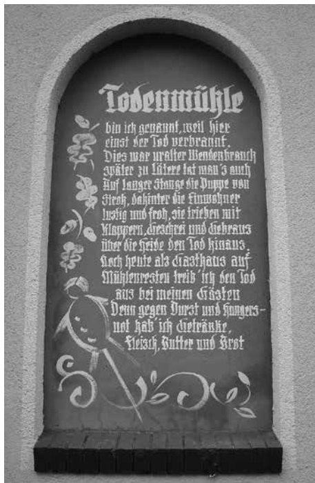
Gedicht über den alten Brauch des Todaustreibens, an der Fassade der Ullersdorfer Mühle, an der Dresdner Heide

aus Stroh, schleppten ihn mit viel Geschrei durch die Gassen, um ihn dann vor den Toren der Stadt in eine sumpfige Grube zu werfen. Der Älteste von ihnen fand am Ufergelände der Röder ein Kraut mit einer verdickten Wurzel. Er hielt es für eine Möhre. Welch fataler Irrtum. Er rief noch den anderen Jungs zu „wer von der Wurzel ist, kann schneller laufen“. Also gesagt, getan! Doch oje, war nix mit Möhrchen, sie bissen in die Wurzel der Schierlingspflanze.