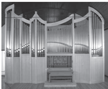
Rühle-Organ in Berlin Mahlsdorf