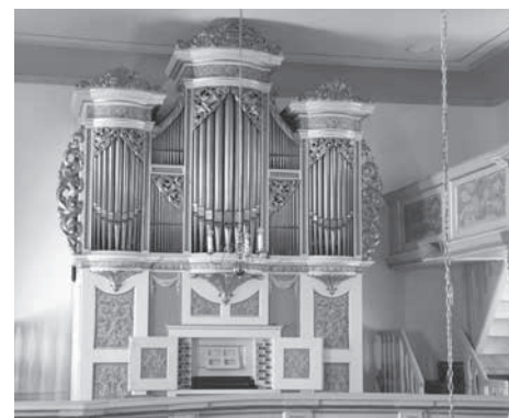
Silbermann-Organ in Fraureuth