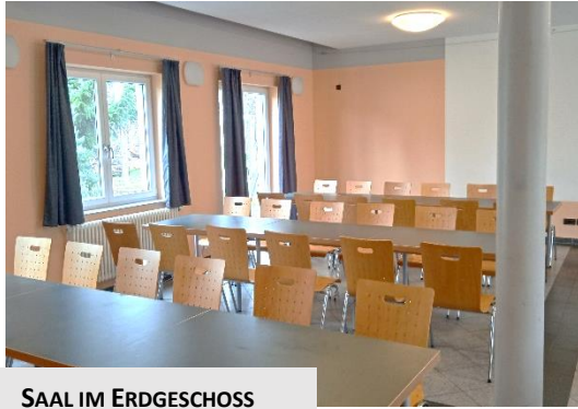
SAAL IM ERDGESCHOSS