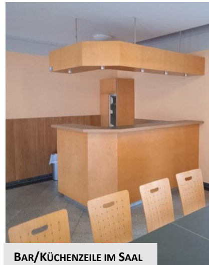
BAR/KÜCHENZEILE IM SAAL