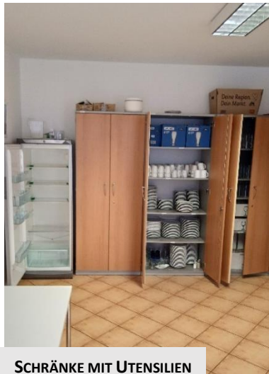
SCHRÄNKE MIT UTENSILIEN