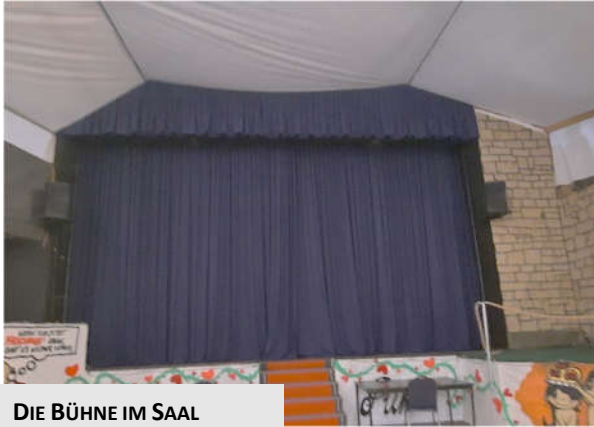
DIE BÜHNE IM SAAL